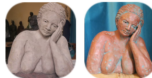
« La Montagne » (Isabelle Haas)

Les couleurs rehaussent les volumes et mettent admirablement en valeur le modelé, la lumière ayant une meilleure prise sur les reliefs.